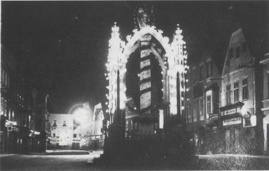
Öllichter um die Mariensäule auf dem Oberen Stadtplatz am Vorabend des Fronleichnamfestes; bis 1937